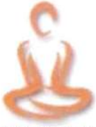
Grafik: Stephan Eideloth